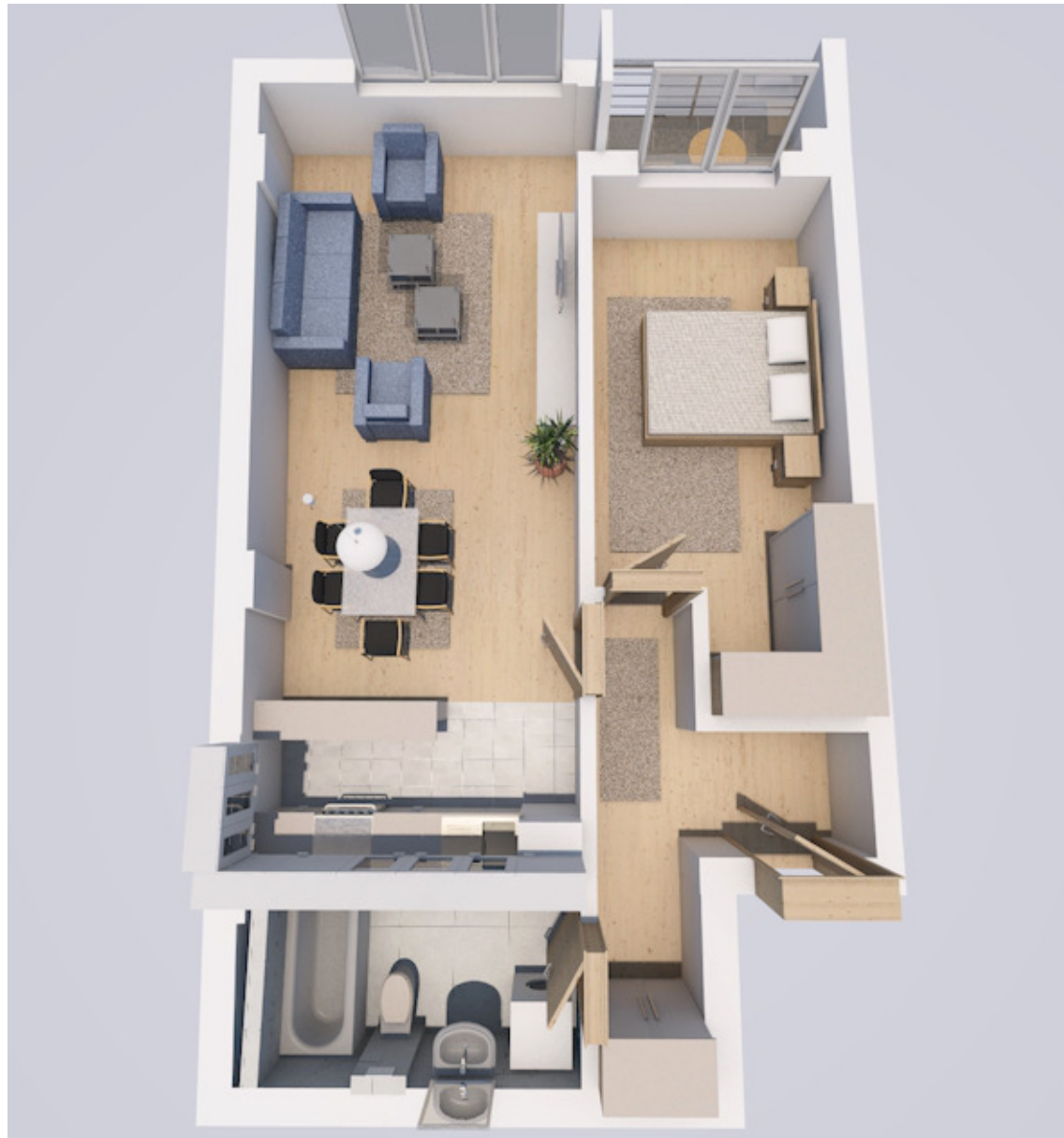
СТАН „15“ - 3 КАТ 58.00 + 4.00 = 62.00м2